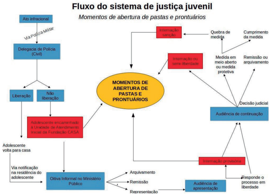
Figura 1 – Fluxo do sistema de justiça juvenil

Pesquisadores do Núcleo de Estudos da Violência da USP tiveram acesso ao universo de 115.639 pastas e prontuários de adolescentes que tiveram sua primeira entrada na FEBEM-SP entre 1990 e 2006, tendo sorteado uma amostra representativa de 1581 documentos (ALVAREZ et al., 2009) 1 . O banco de dados constituído contém informações como a medida socioeducativa aplicada (internação, semiliberdade, liberdade assistida, entre outras), o ato infracional cometido (bem como data e local do ato e se houve presença de copartícipes) e o perfil do adolescente em conflito com a lei (sexo, idade, cor da pele atribuída por funcionários da delegacia, naturalidade, filiação, profissão, escolaridade, referência e ocupação dos pais, se é usuário de drogas, entre outras). Trata-se de um conjunto de observações empíricas que permite testar ambas as hipóteses discutidas aqui.